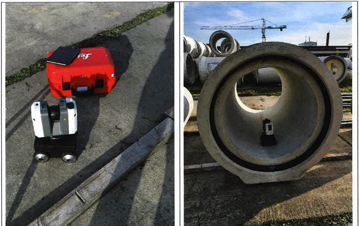
Abbildung 2: Eingesetztes 3D-Laserscansystem (links) und Anwendung im Rohr (rechts)

Der Auftraggeber hatte bereits im Vorfeld der IKT-Messung eigene Messungen des Kanalrohrinnenumfangs mit seinem 3D-Laserscansystem durchgeführt (vgl. Abbildung 2). Dabei wurde am Prüfkörper 1 zusätzlich eine Messung mit nasser Rohrinnenfläche vorgenommen. Die Messergebnisse wurden dem IKT am 12.11.2021 schriftlich übermittelt.